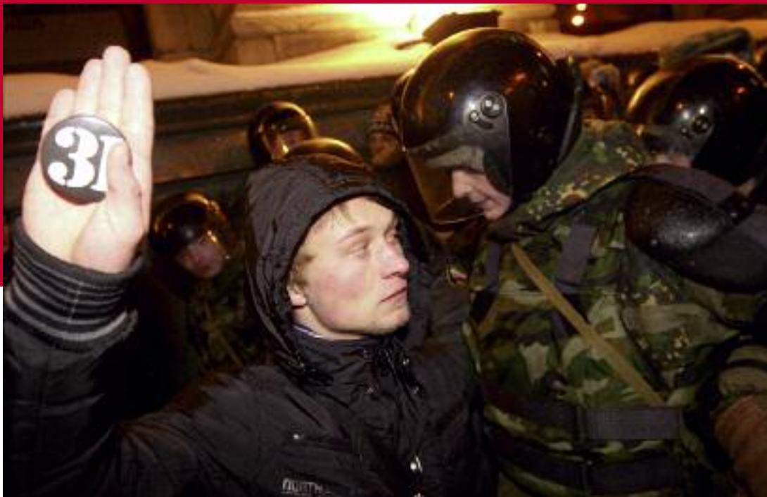
Demonstration für Artikel 31 der russischen Verfassung, der Versammlungsfreiheit garantiert.

genau verboten sind. Die Strafen für Zuwiderhandlungen gegen diese Gesetze betragen zum Teil mehrere zehntausend Euro, im schlimmsten Fall können Medien vorübergehend geschlossen werden.