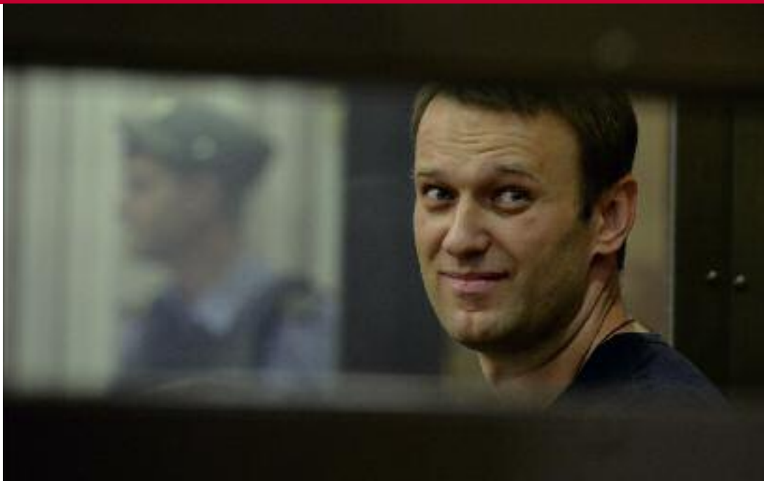
Den Kremlkritiker Alexej Nawalny schwiegen die staatlichen TV-Kanäle lange Zeit tot.

Im November 2012 verschärfte die Duma zudem das Gesetz über Landesverrat und Spionage. Es weitet die entsprechenden Straftatbestände aus: So fallen unter Landesverrat nun sämtliche Handlungen, die ganz allgemein die Sicherheit des Landes gefährden, zuvor war dies auf die »äußere Sicherheit« beschränkt. Wer als Spion verklagt wird, muss nach dem neuen Gesetz nicht mehr zwangsläufig im Auftrag ausländischer Geheimdienste gearbeitet haben. Die vorgesehenen Strafen für Verstöße gegen das Gesetz wurden auf bis zu 500.000 Rubel (ca. 11.000 Euro) bzw. acht Jahre Gefängnis erhöht. 25 Menschenrechtsgruppen wie das International Center for Not-for-Profit Law kritisierten, die schwammigen Formulierungen des Gesetzes machten es möglich, jeden beliebigen Kritiker als Landesverräter zu brandmarken. 26 Entgegen seinem Versprechen vor dem Menschenrechtsrat am 12. November, die Regelungen erneut zu überdenken, unterzeichnete Präsident Putin das Gesetz noch am selben Tag. 27