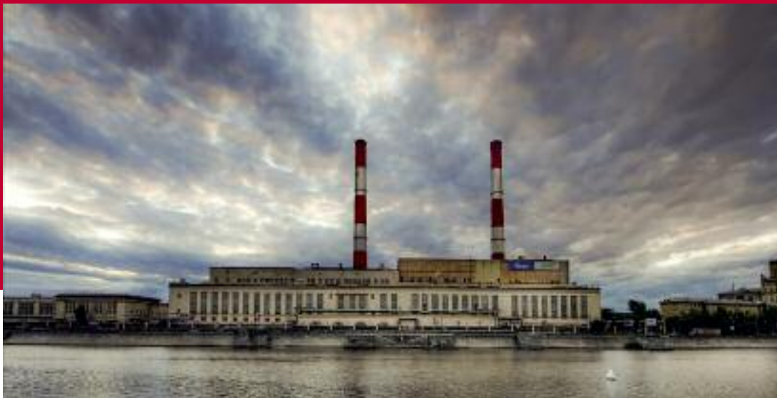
Gasprom-Anlage in Moskau. Die Medienholding des staatlichen Energie- konzerns besitzt unter anderem den Fernsehsender NTV.