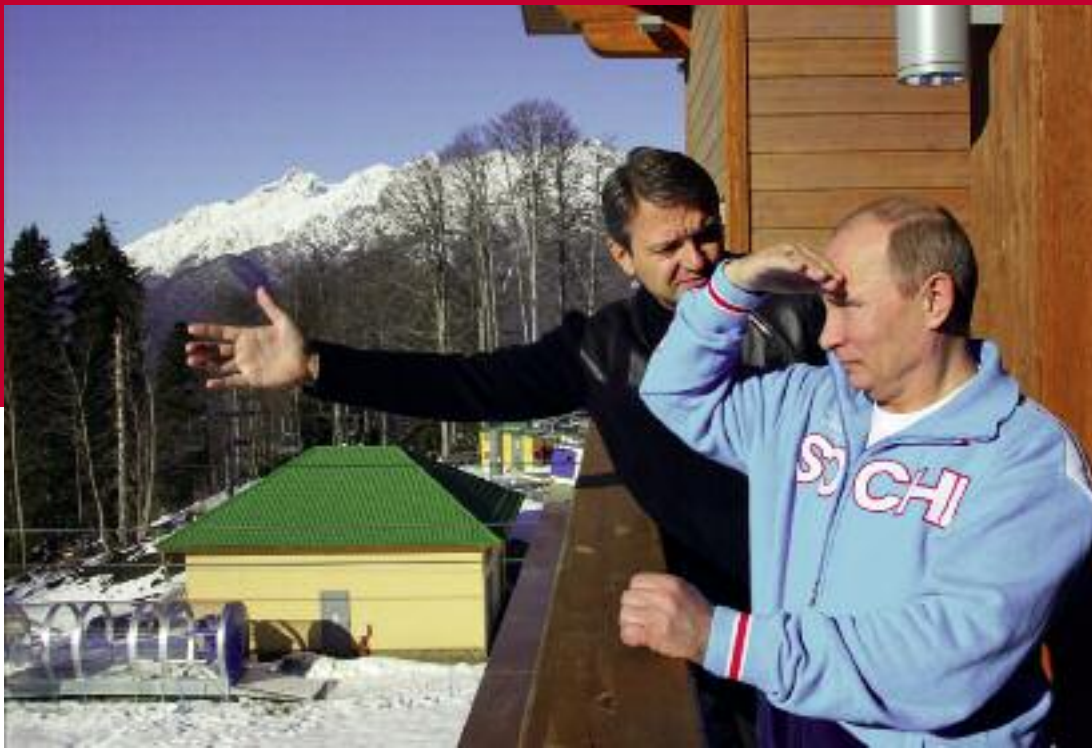
Präsident Wladimir Putin (rechts) und Gebietsgouverneur Alexander Tkatschow bei einem Besuch in Sotschi im Winter 2013.

Berichterstattung der überregionalen Kanäle bilden. Gouverneur Alexander Tkatschow, wie Putin seit dem Jahr 2000 an der Macht, hat die wichtigsten Sender der Region fest unter Kontrolle. Dazu gehören die Regionalredaktionen der staatlichen Medienholding WGTRK ( GTRK Sotschi und GTRK Krasnodar ), der 9. Kanal (ehem. Nowyj TV Kuban , ein einst privater Sender, den Tkatschow kurz nach seinem Machtantritt kaufte) sowie EFKATE , der regionale Ableger von Ren-TV . Die Gebietsverwaltung kontrolliert diese Sender durch gezielte Personalpolitik, die regimekritische Journalisten ausschließt, sowie durch ein so genanntes Medienregister, das eingetragenen Medien Finanzhilfen und Steuererleichterungen zusichert. 4