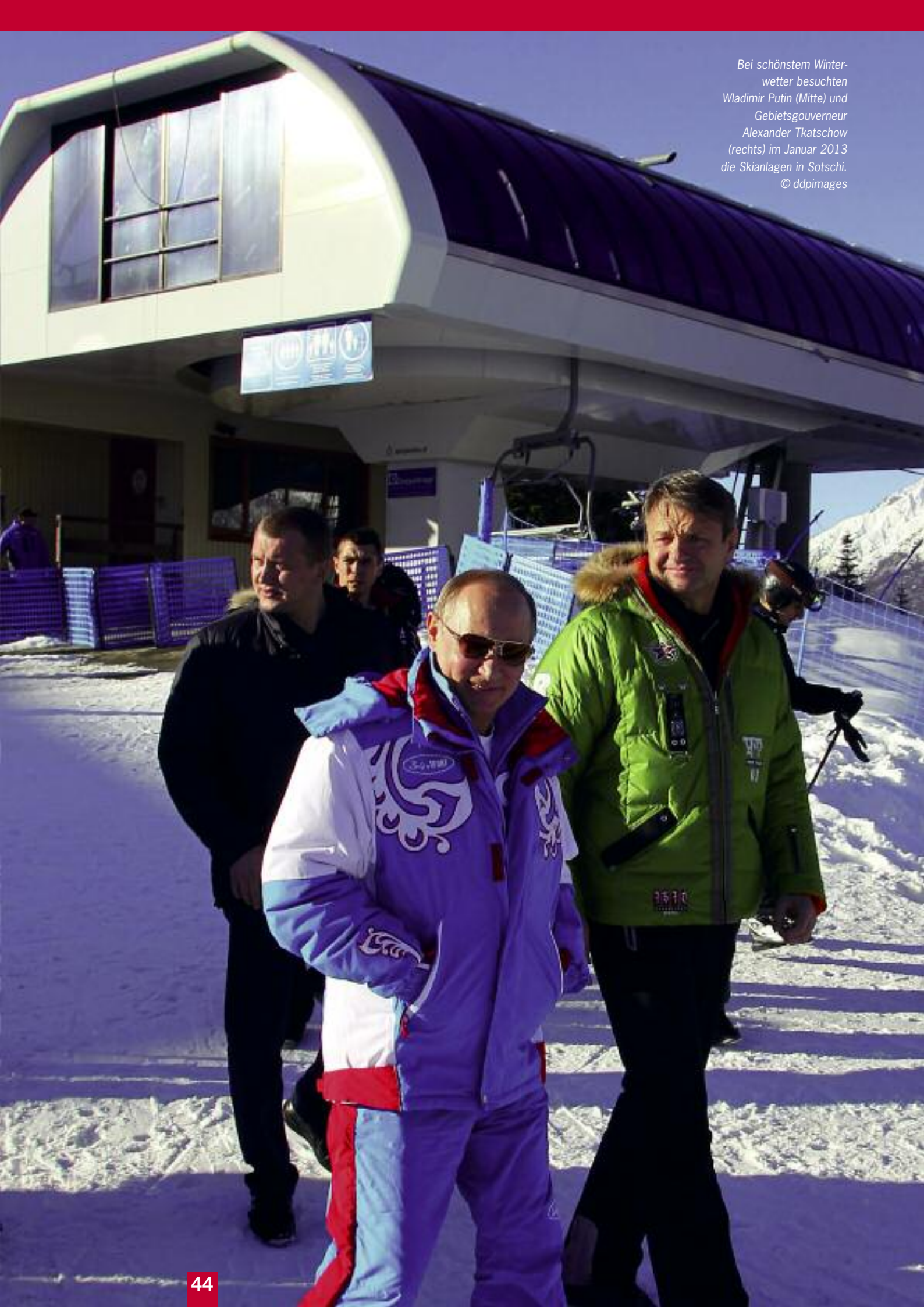
Bei schönstem Winterwetter besuchten Wladimir Putin (Mitte) und Gebietsgouverneur Alexander Tkatschow (rechts) im Januar 2013 die Skianlagen in Sotschi.