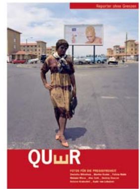
Quer Fotos für die Pressefreiheit Ausgabe 2006 ISBN 978-3-937683-06-5