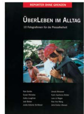
ÜberLeben im Alltag. Fotos für die Pressefreiheit Ausgabe 2002 ISBN 3-9806917-4-8