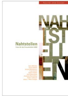
Nahtstellen Fotos für die Pressefreiheit Ausgabe 2008 ISBN 978-3-937683-19-5