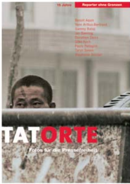
Tatorte Fotos für die Pressefreiheit Ausgabe 2009 ISBN 978-3-937683-23-2