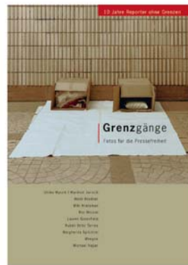
Grenzgänge Fotos für die Pressefreiheit Ausgabe 2004 ISBN 3-937683-00-3