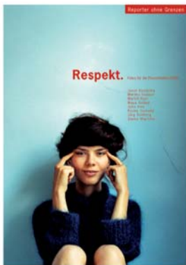
Respekt. Fotos für die Pressefreiheit Ausgabe 2005 ISBN 3-937683-01-1