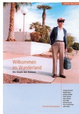
Willkommen im Wunderland Fotos für die Pressefreiheit Ausgabe 2003 ISBN 3-9806917-7-2